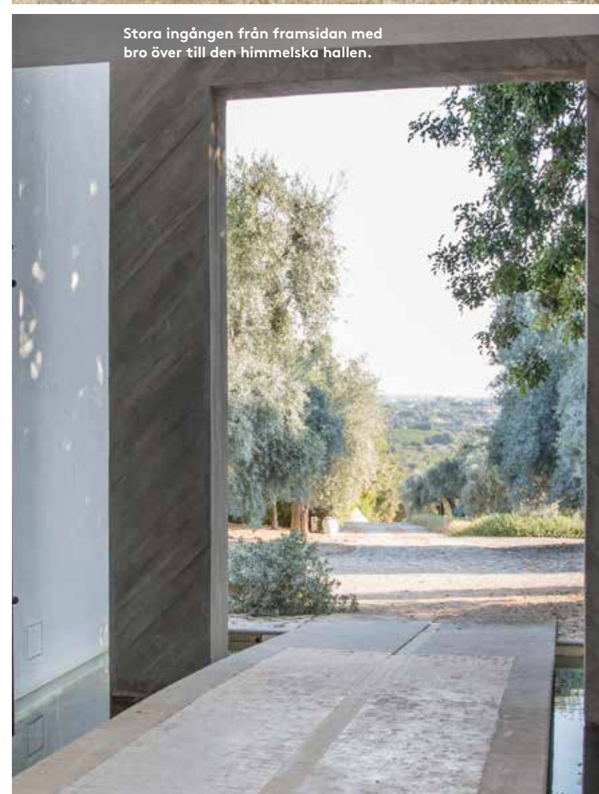
Stora ingången från framsidan med bro över till den himmelska hallen.