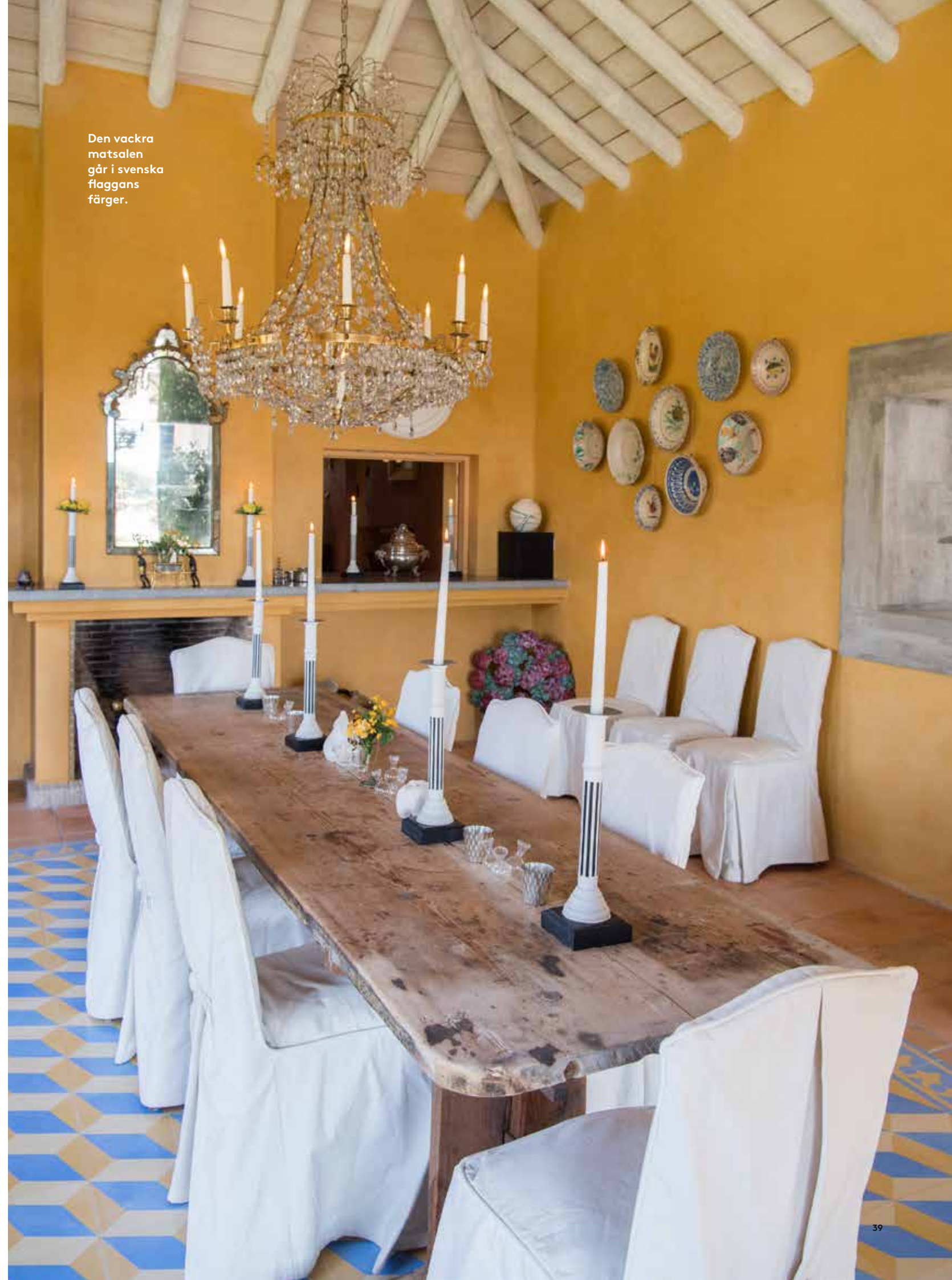
Den vackra matsalen går i svenska flaggans färger.

– Länge var Frankrike vår bästa kund, men