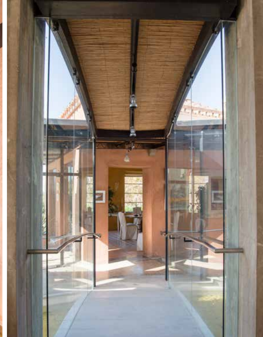
Det unika "stupröret" som samlar in takvattnet går genom hela huset. Bron över vattnet från vardagsrummet till matsalen.