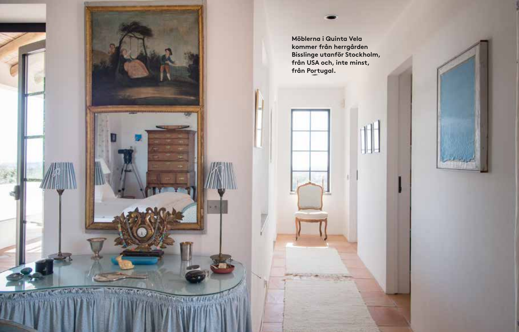
Möblerna i Quinta Vela kommer från herrgården Bisslinge utanför Stockholm, från USA och, inte minst, från Portugal.