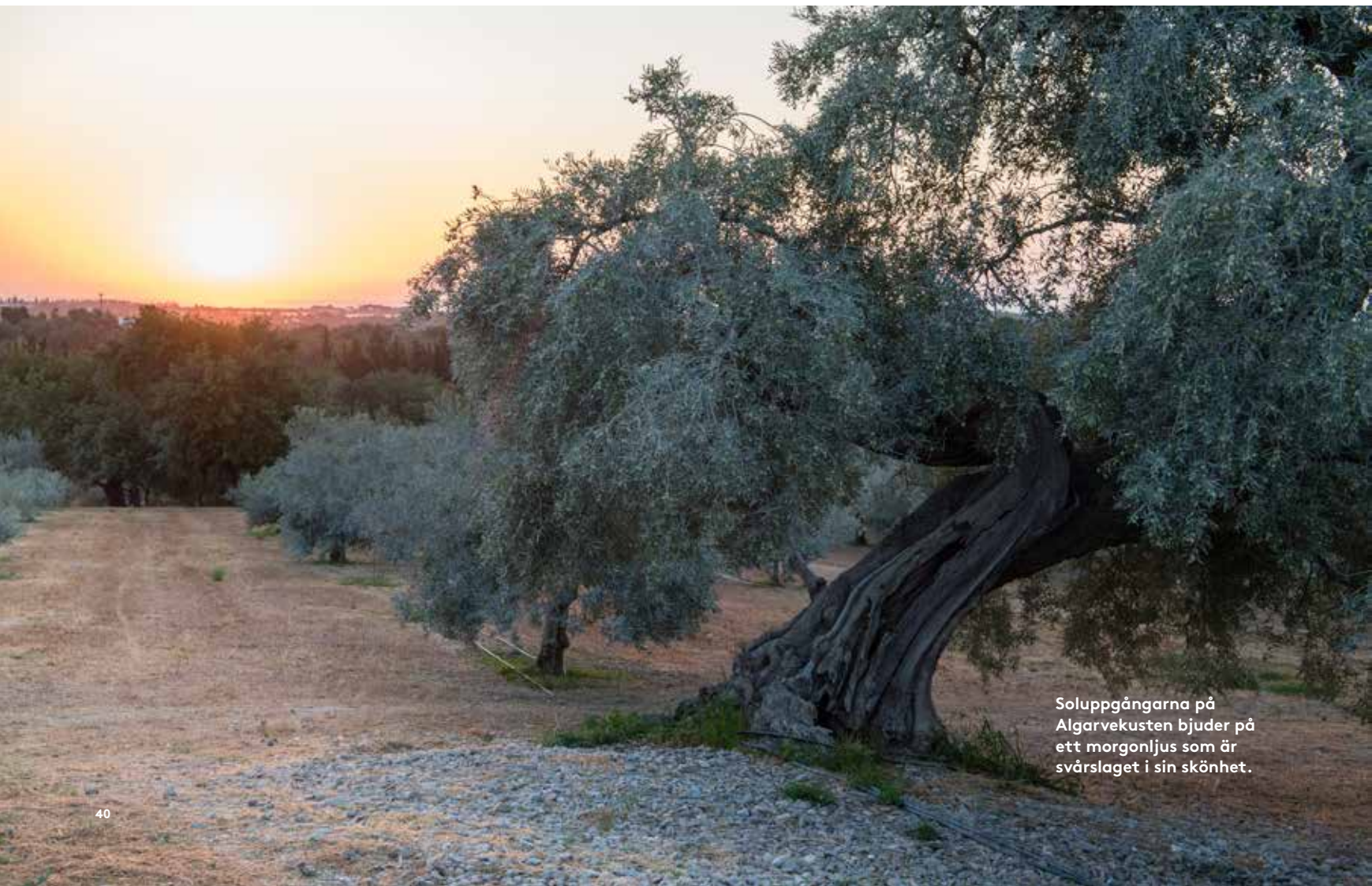
Soluppgångarna på Algarvekusten bjuder på ett morgonljus som är svårslaget i sin skönhet.

ris, Shanghai, Portugal, Sverige (bl a klubbhus för en exklusiv golfklubb). Nyligen vann han en arkitekttävling om ett kontorskomplex i Stockholmsregionen. Läs mer: www.architecturelab.net/jewel-box-switzerland-dps-studio www.behance.net/design_paradigms