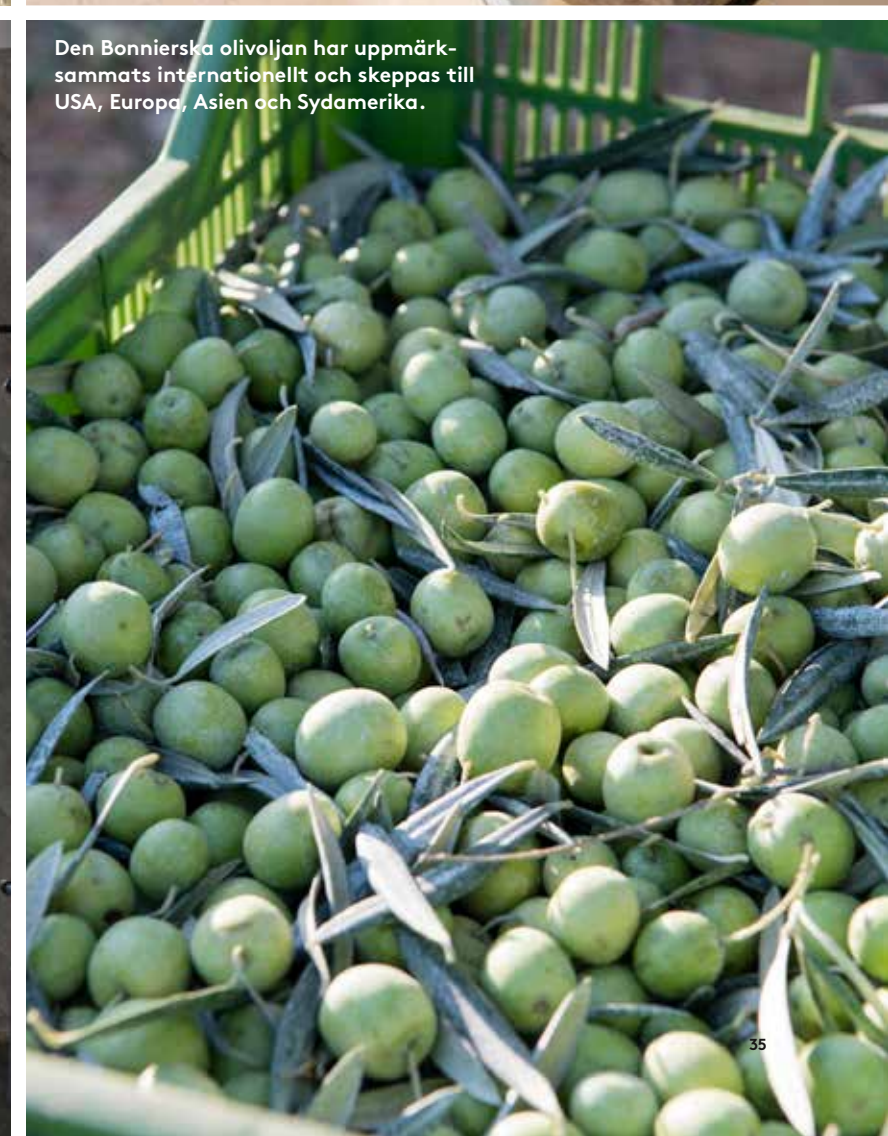
Den Bonnierska olivoljan har uppmärksamats internationellt och skeppas till USA, Europa, Asien och Sydamerika.