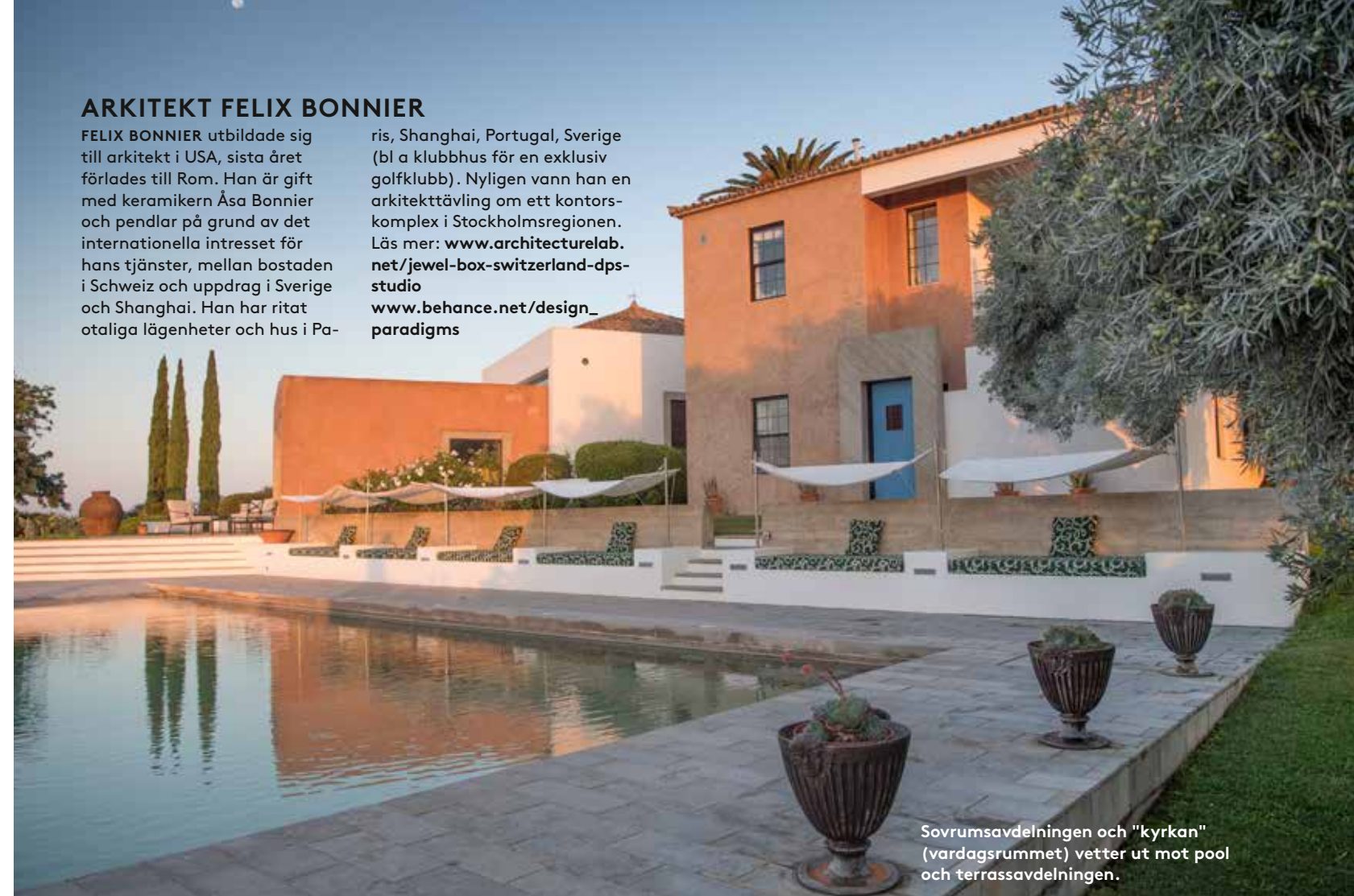
Sovrumsavdelningen och "kyrkan" (vardagsrummet) vetter ut mot pool och terrassavdelningen.