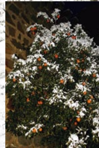
Bildtext bild tex tbil ddd- text illd tex tbil dddtext illd tex tbil dddtext

P å ankomstdagen sista veckan i januari ligger våren i luften och termometern visar tolv plusgrader. Men vädergudarna spelar de förväntansfulla jägarna ett spratt. Efter en natts inkvartering i den lilla byn Jarandilla konstaterar de missnöjt att nattens