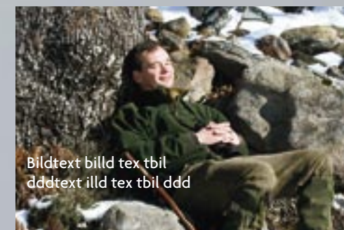
Bildtext bild tex tbil dddtext illd tex tbil ddd

”Det var min första jakt i Spanien, men definitivt inte min sista”