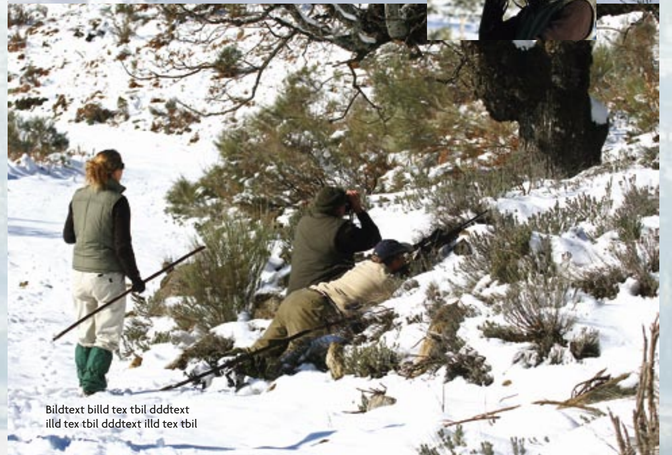
Bildtext bild tex tbil dddtext illd tex tbil dddtext illd tex tbil dddtext